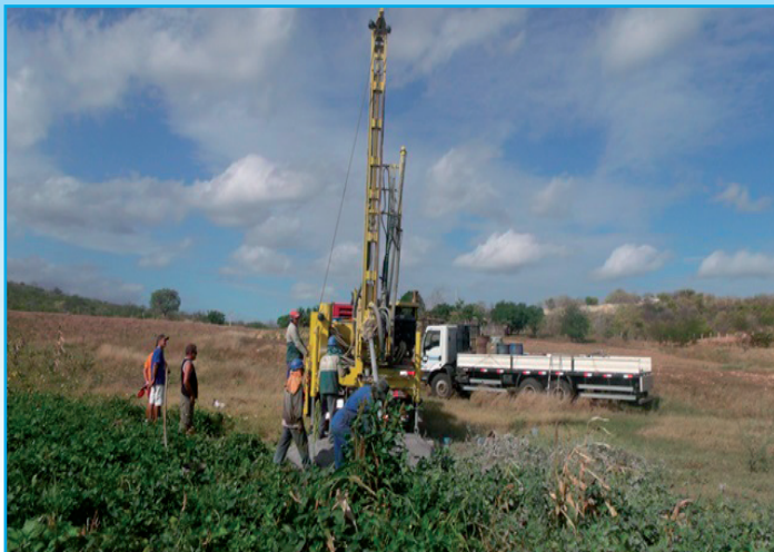
Máquinas trabalhando na escavação de poços tubulares da zona rural de Jardim do Seridó

A Prefeitura Municipal de Jardim do Seridó celebrou Termo de Convênio com a Associação dos Municípios da Microrregião do Seridó Oriental (AMSO), para o gerenciamento e execução na perfuração de 5 (cinco) poços tubulares na Zona Rural do município de Jardim do Seridó.