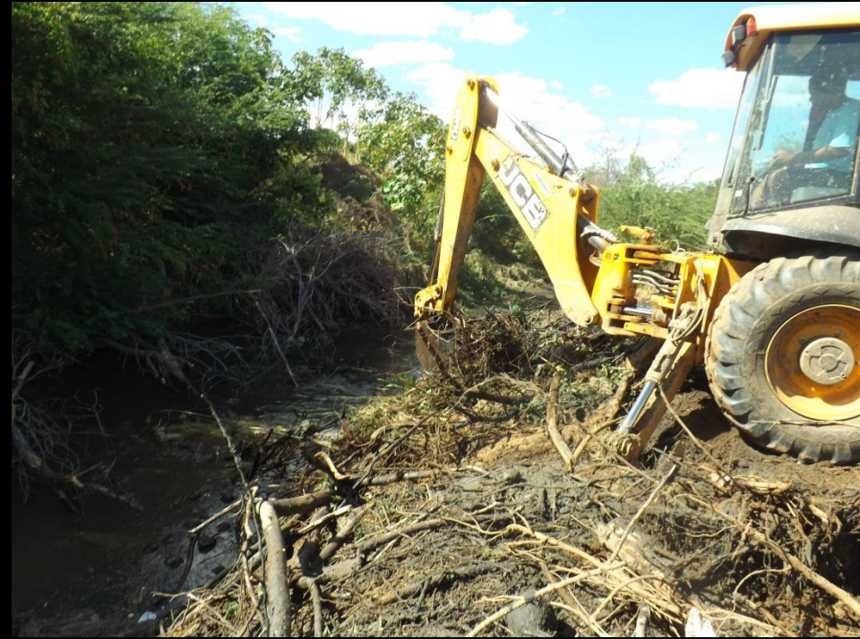
Figura 14: Limpeza do leito do rio Condado-Conceição PB.