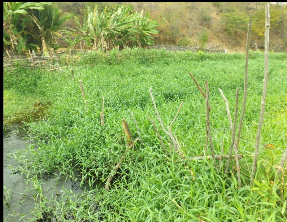
Figura 7: Trechos do rio obstruído.