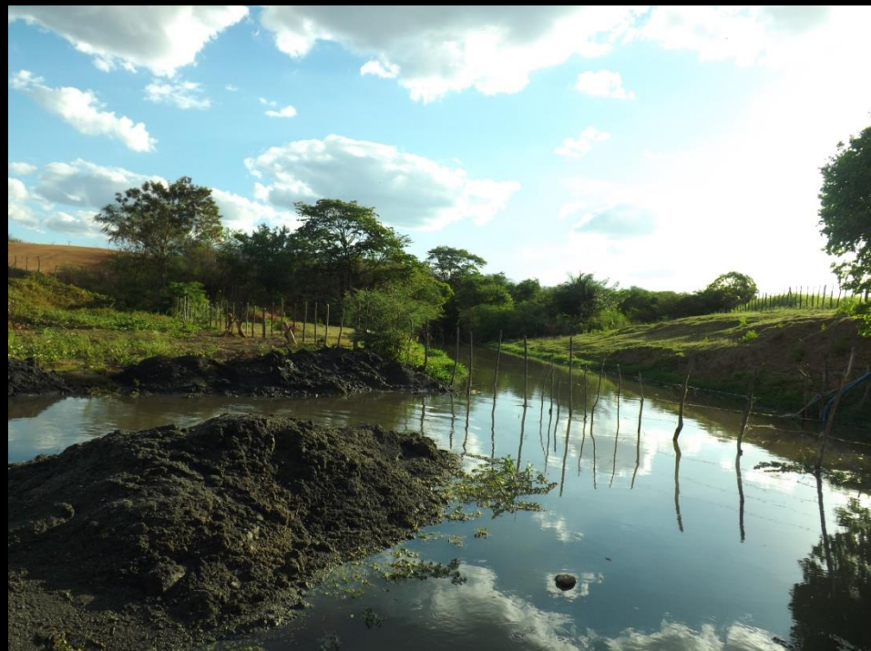
Figura 16: Limpeza do leito do rio Condado-Conceição PB.