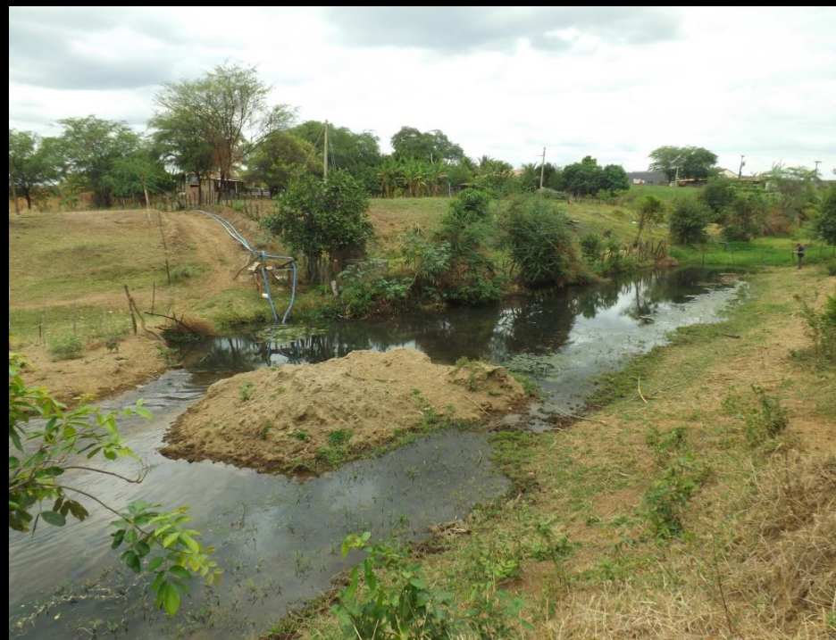
Figura 8: Trechos do rio obstruído.