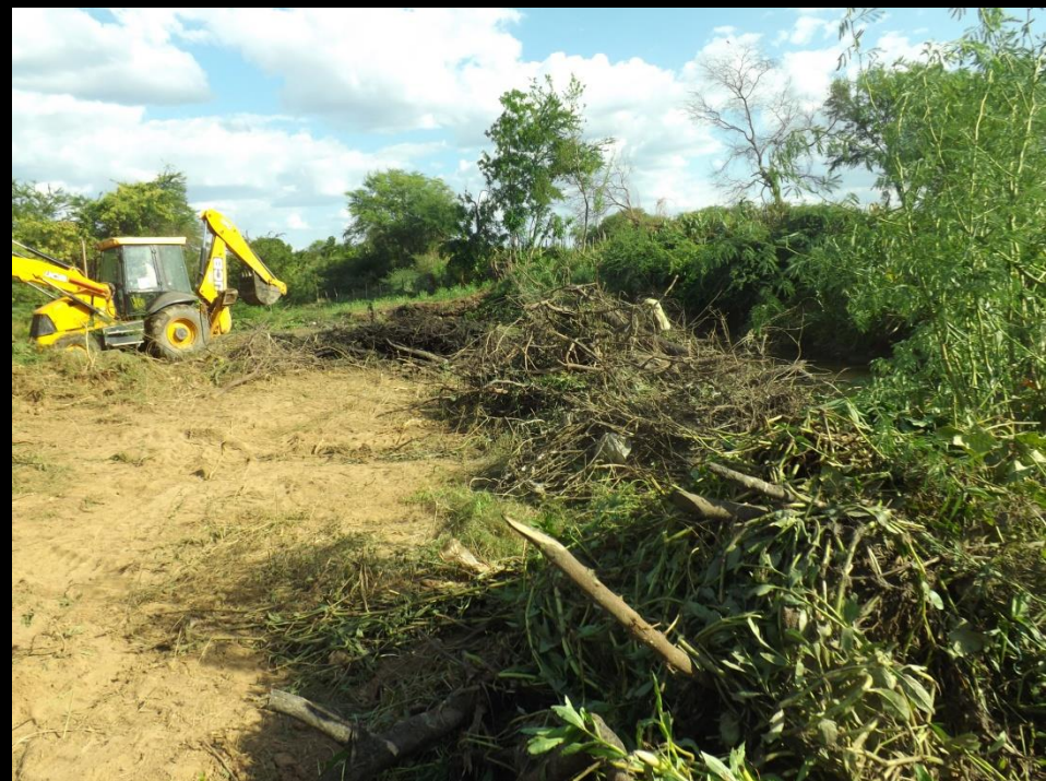
Figura 11: Limpeza do leito do rio Condado-Conceição PB.