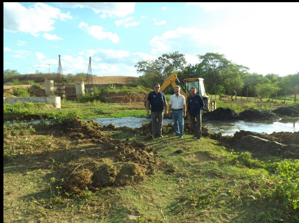
Figura 17: Limpeza do leito do rio Condado-Conceição PB.