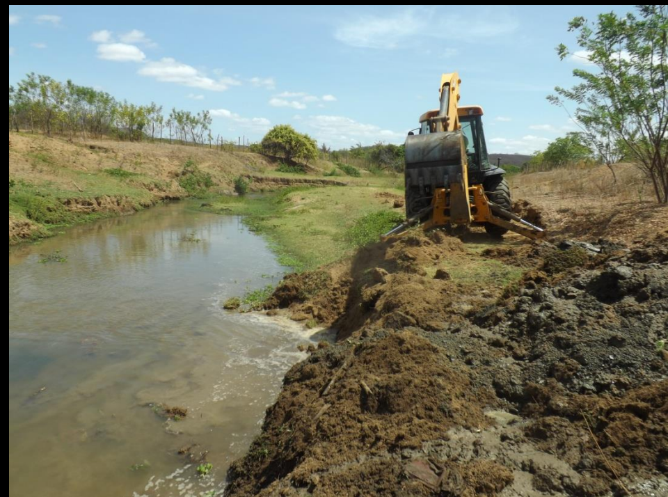
Figura 18: Retirada de barramento de pedra do rio Condado-Conceição PB.