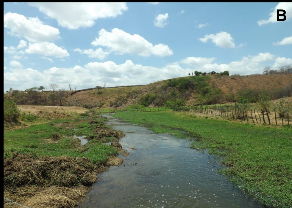
Figura 3: Excesso de vegetação a jusante da passagem molhada localizada na comunidade boa vista. (A) antes da limpeza, (B) após a limpeza.