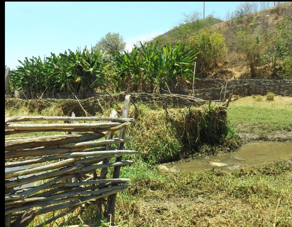
Figura 4: Obstrução do leito do rio por cercas, vegetação, Boa Vista, Conceição - PB.