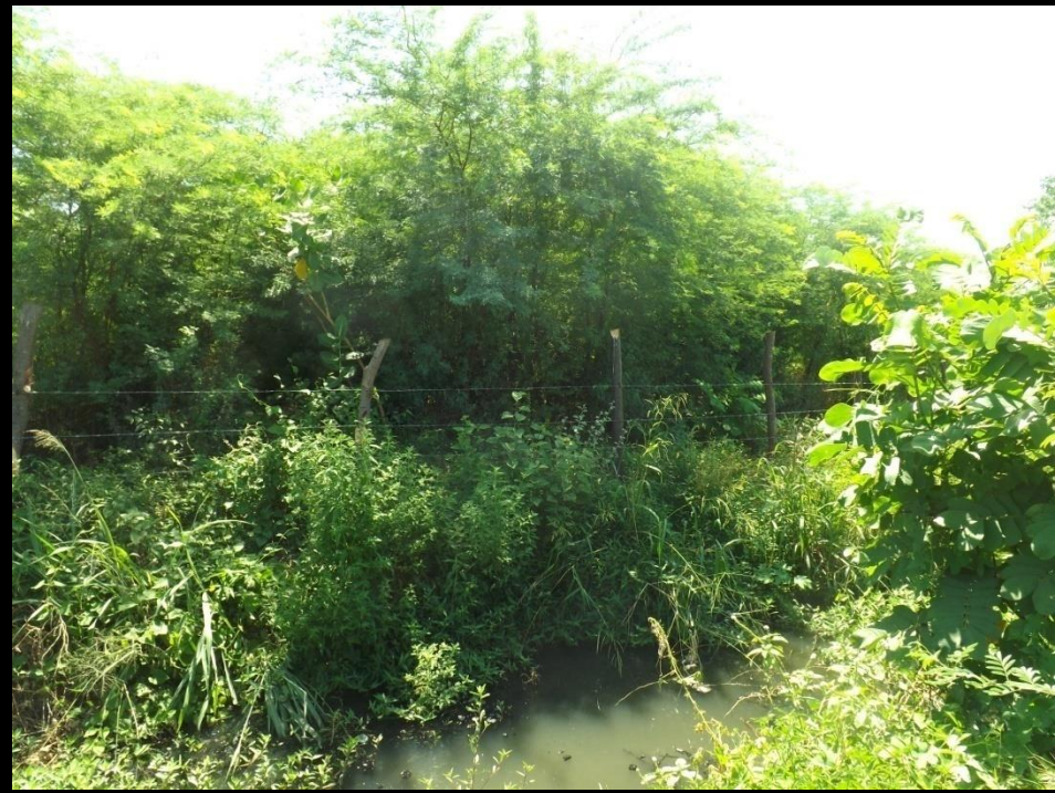
Figura 9: Limpeza do leito do rio Condado-Conceição PB.