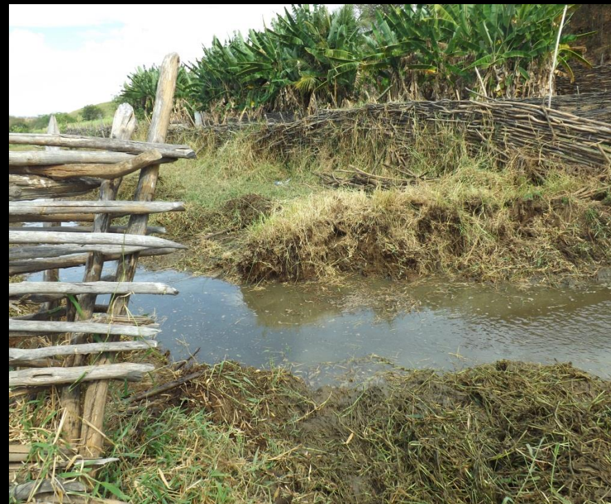
Figura 5: Retirada de cerca de varas, vegetação, Boa Vista, Conceição - PB.