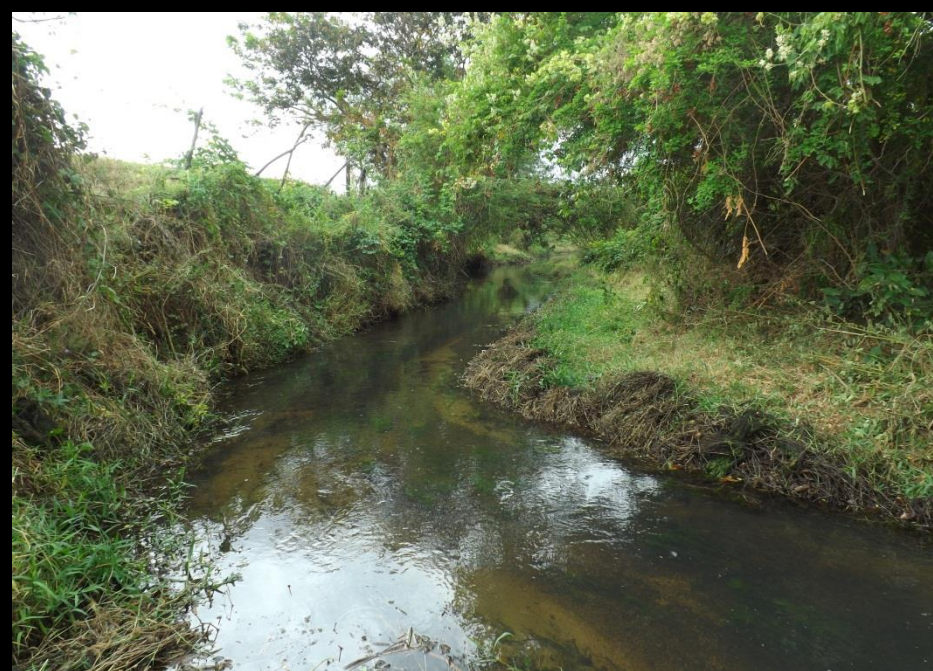
Figura 6: Trechos do rio após a realização da limpeza.