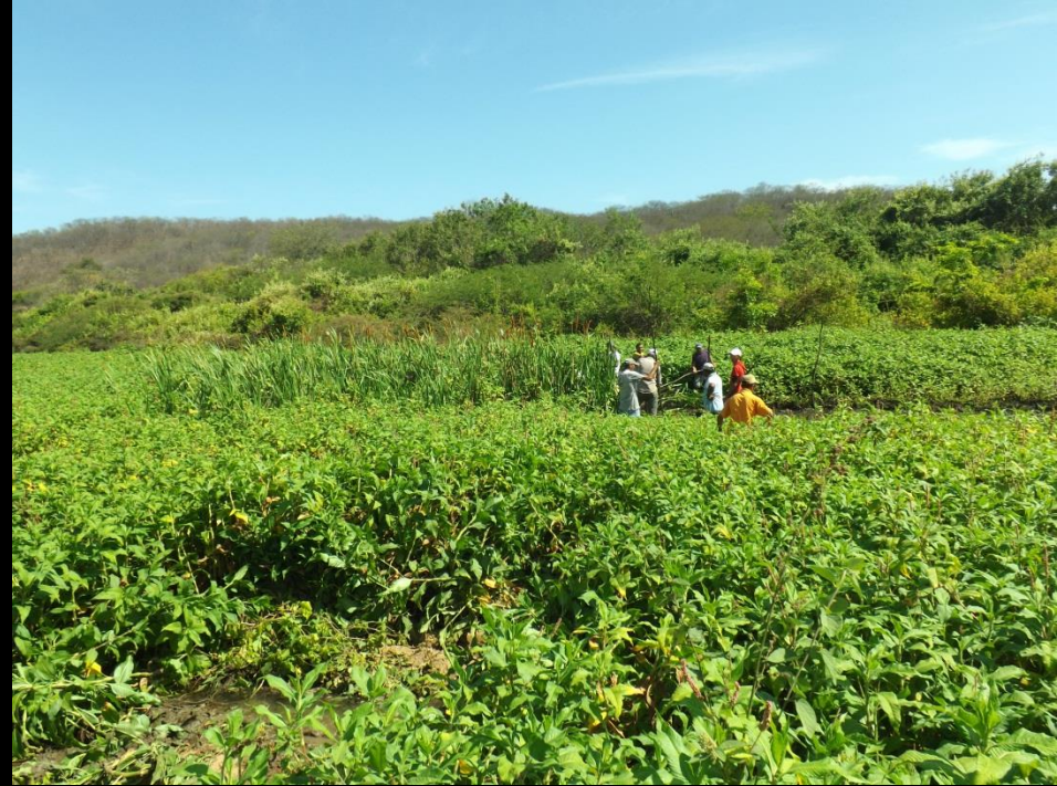
Figura 1: Excesso de vegetação a montante da passagem molhada (A); Equipe coordenada pela AESA. Comunidade boa vista, Conceição - PB.