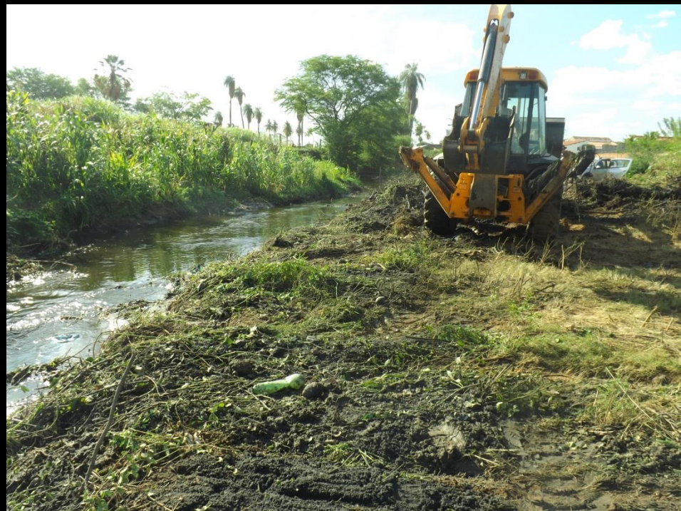
Figura 12: Limpeza do leito do rio Condado-Conceição PB.