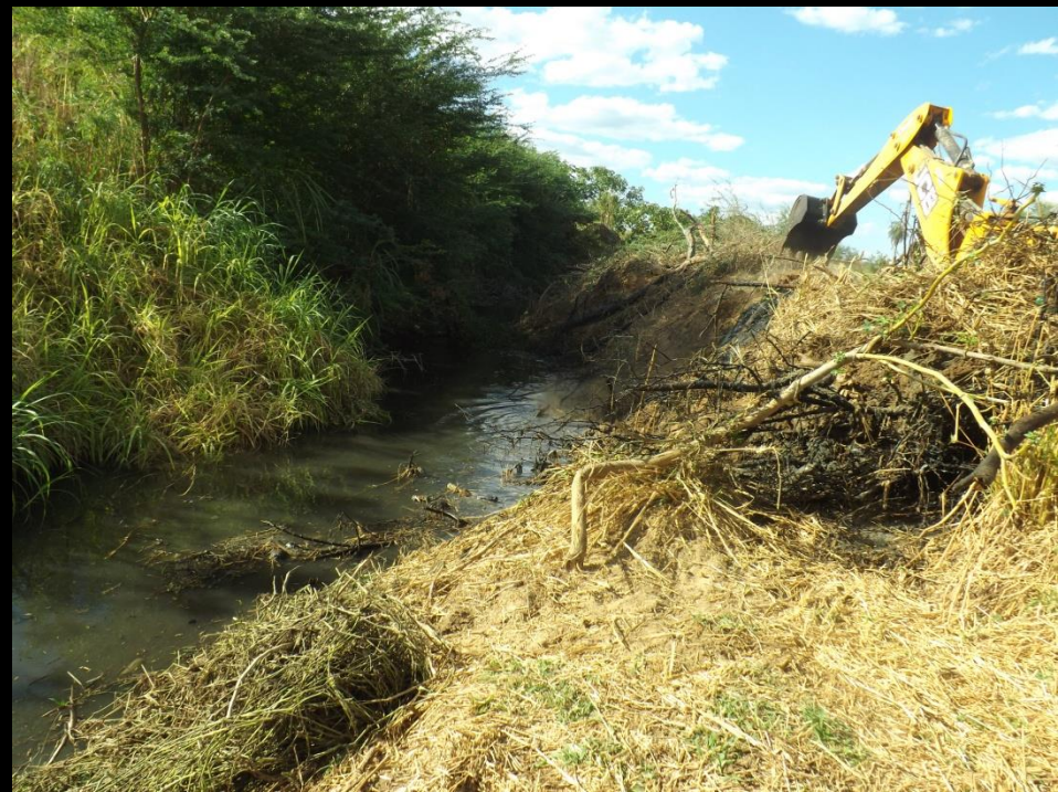
Figura 15: Limpeza do leito do rio Condado-Conceição PB.