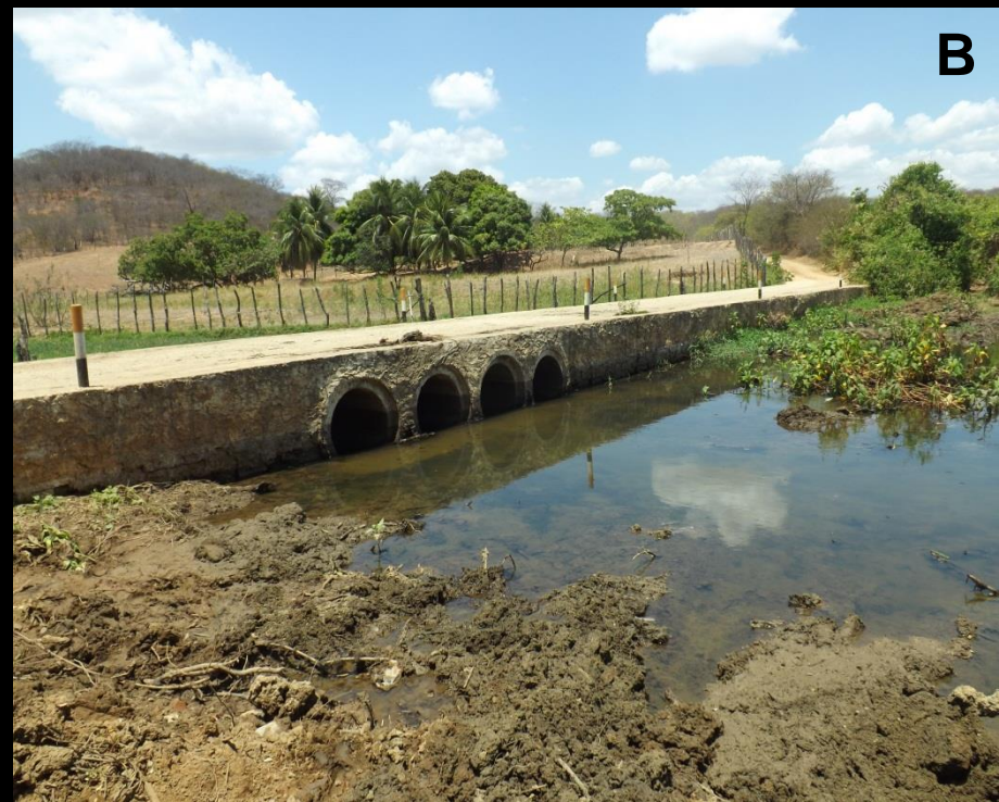
Figura 2: Excesso de vegetação a montante da passagem molhada localizada na comunidade boa vista. (A) antes da limpeza, (B) após a limpeza.

Coordenadas: Lat – 07° 35' 06,6" S Lon – 036° 32' 25,2" w