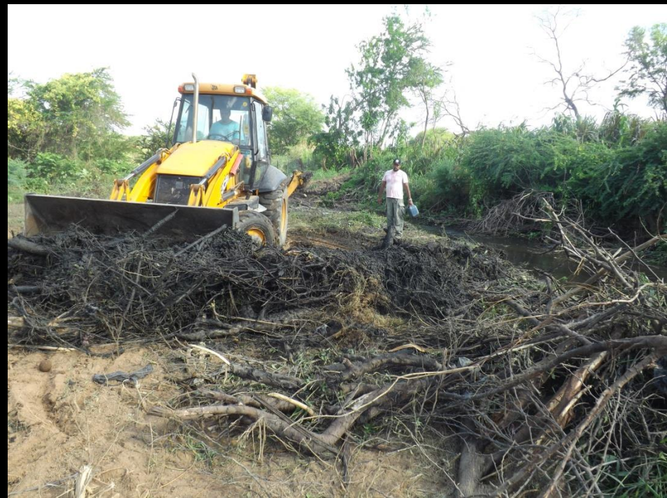
Figura 13: Limpeza do leito do rio Condado-Conceição PB.