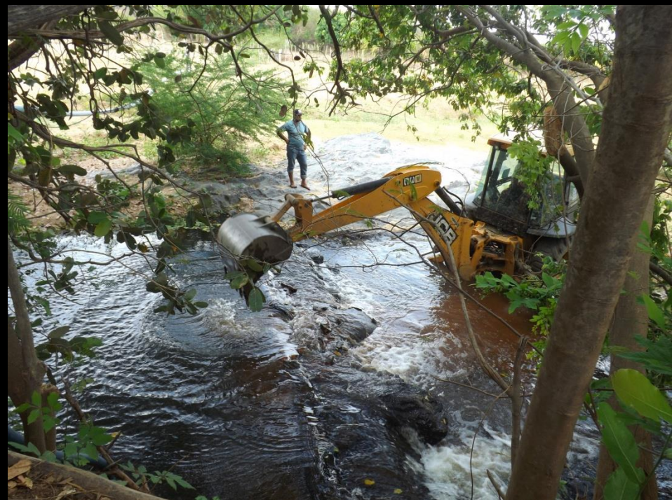
Figura 19: Retirada de barramento de pedra do rio Condado-Conceição PB.