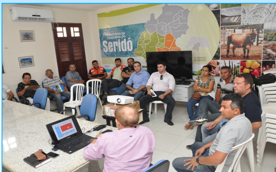
Entidades reunidas na sede da Adese em Caicó/RN

Outro ponto abordado na reunião foi a realização de um estudo geofísico, através da Universidade Federal do RN, para saber se as carretas e carros pesados que passam pela rodovia que cruza o Açude, produzem impacto físico e mecânico na estrutura da