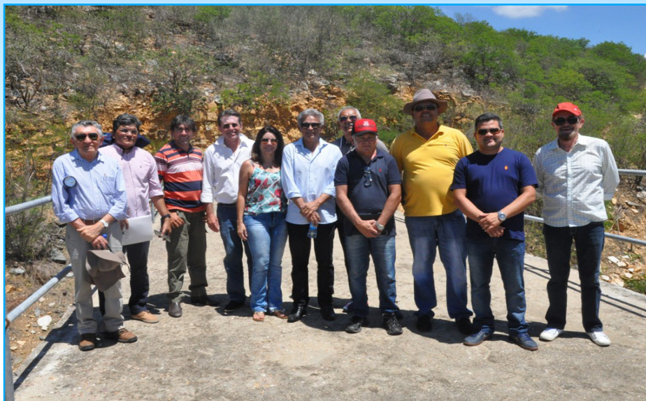
Técnicos da Semarh em visita ao lado de outras instituições do Seridó

“A sociedade tem todo o direito de fazer suas reclamações e nós estamos presentes para verificar o que está acontecendo e vamos tomar todas as providências. Vamos dar a ordem de serviço para que a empresa comece a fazer os serviços necessários, que são os estudos de consultoria e diagnóstico da barragem. É essa consultoria