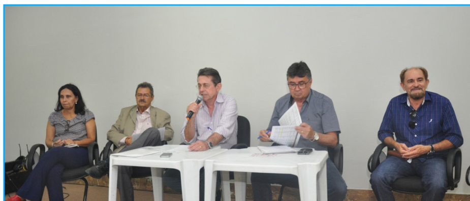
Membros da mesa diretora do CBH PPA reunidos em plenária do comitê

Nas próximas páginas é possível acompanhar, de forma detalhada, todas as informações do relatório das atividades do CBH PPA. Confiram!