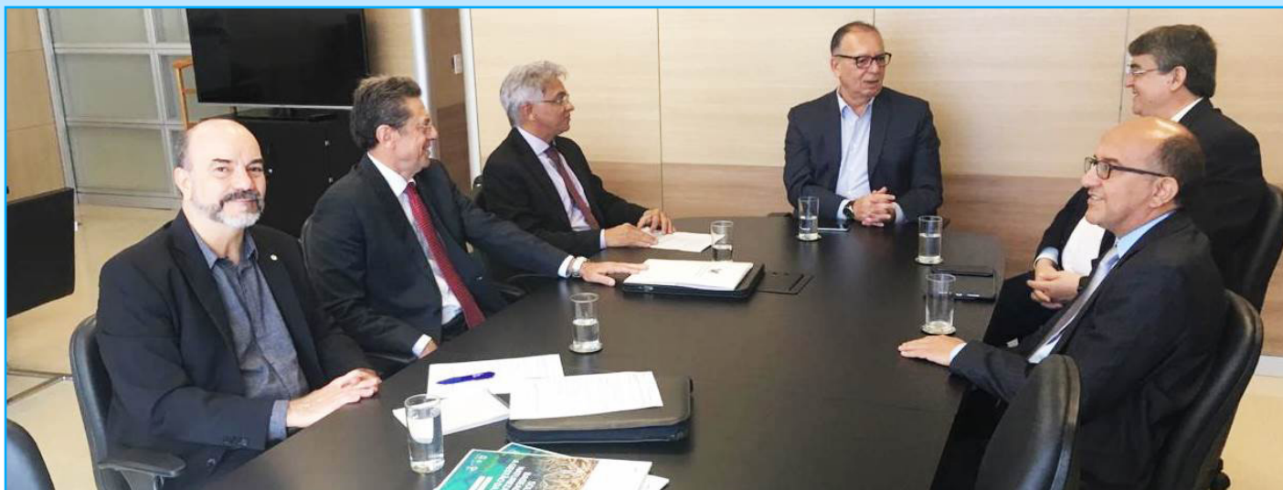
Reunião em Brasília tratou assuntos importantes para a bacia do Piranhas-Açu, sobretudo na questão de investimentos hídricos