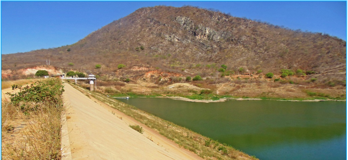
Açude Eng. Ávidos, em Cajazeiras/PB é um dos reservatórios que está inserido na resolução conjunta da ANA com a AESA

A Agência Nacional de Água – ANA solicita aos usuários outorgados de recursos hídricos para a finalidade de irrigação e/ou aquicultura e que possuam o benefício de desconto na tarifa de energia elétrica, deverão atualizar seu cadastro no sistema REGLA o número da unidade consumidora de energia elétrica (número da instalação constante na conta de energia elétrica). A solicitação é destinada aos usuários dos reservatórios Eng. Ávidos e São Gonçalo,