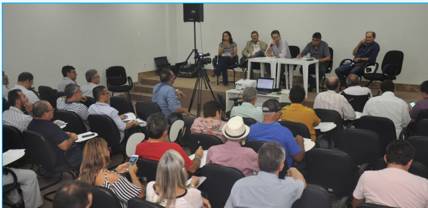
Ações do Comitê da Bacia Hidrográfica do Piancó-Piranhas-Açu foram desenvolvidas em todas as áreas da bacia

O Comitê da Bacia Hidrográfica do Piancó-Piranhas-Açu – CBH PPA publicou em janeiro o relatório anual das atividades, ano 2018, desenvolvidas em toda a bacia. No documento é possível acompanhar o que aconteceu nas Reuniões Ordinárias e Extraordinárias, o trabalho da Câmara Técnica de Planejamento Institucional – CTPI, as reuniões da Diretoria Colegiada, os cursos realizados durante o ano, os boletins informativos publicados, as reuniões promovidas pelo CBH PPA e pela ANA e os eventos e ações promovidas por instituições parceiras com a participação dos membros do CBH PPA.