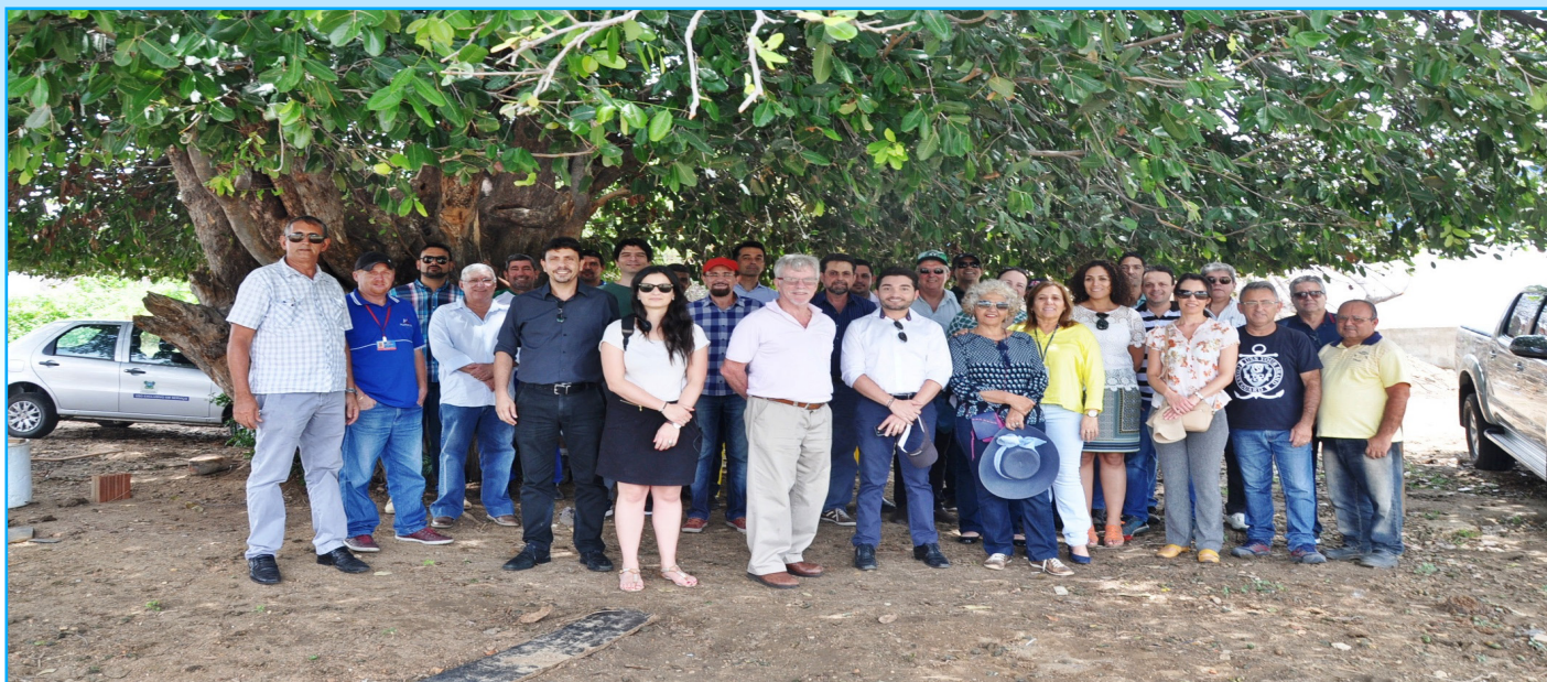
A delegação da OCDE teve a oportunidade de visitar o rio Piranhas, no município de Jardim de Piranhas, no local da captação da Caern

O Comitê da Bacia Hidrográfica do Piancó-Piranhas-Açu recebeu nos dias 13 e 14 de Fevereiro a visita da Organização para a Cooperação e Desenvolvimento Econômico – OCDE, em sua 2ª missão no Brasil. O objetivo foi discutir o estabelecimento e governança de instrumentos econômicos para a política de recursos hídrico. A programação constou de entrevistas com a imprensa, visitas técnicas de campo no açude Itans e na captação da CAERN em Jardins de Piranhas, diálogos com agentes de governo, com usuários e com a sociedade civil. Todas as atividades tiveram o apoio do CBH PPA e da Agência Nacional de Águas – ANA.