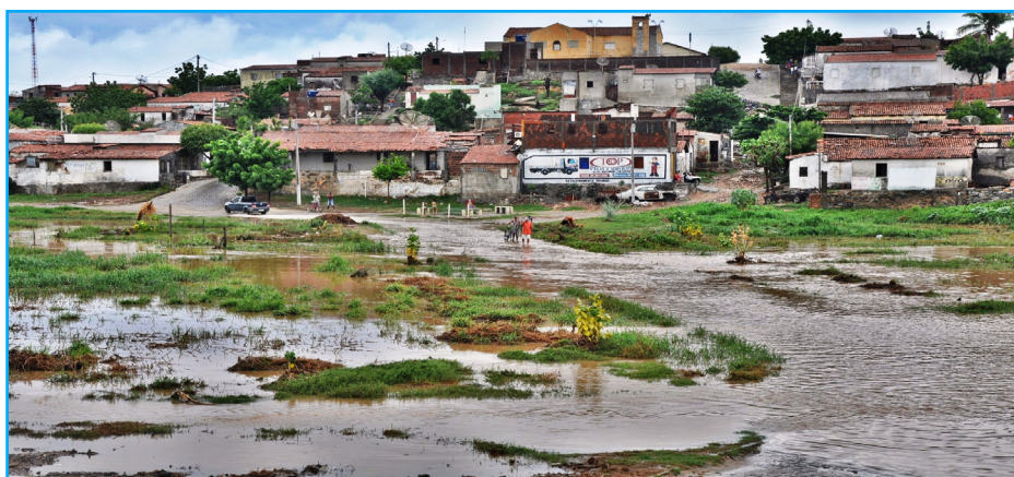
Rio Barra Nova, em Caicó, recebe um bom volume d'água

Já na Paraíba, de acordo com a AESA/PB em 24.02.2017, o reservatório de Curemas, que tem capacidade para acumular 591.646.222 m 3 está com 15.937146 m 3 , ou seja, apenas 2,7% de sua capacidade total. Já o reservatório Mãe D'água, em 22.02.2017, com capacidade de acumular 567.999.146 m 3 , está 24.552.886 m 3 , ou seja, 4,3% de sua capacidade total.