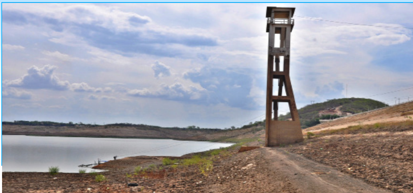
Imagem mostra plenário do auditório da Caern, em Natal/RN, local aonde aconteceu a reunião que discutiu a situação do Curema-Mãe D'água

O Comitê da Bacia Hidrográfica do Piancó-Piranhas-Açu – CBH PPA visitou no dia (10/02) o açude Curemas, no município de Coremas/PB. O objetivo foi observar a situação atual do abastecimento do Coremas-PB, comunicar a prefeitura a necessidade de fechamento imediato da comporta de montante do Adutor 1 e encontrar providências necessárias à continuidade do abastecimento do município.